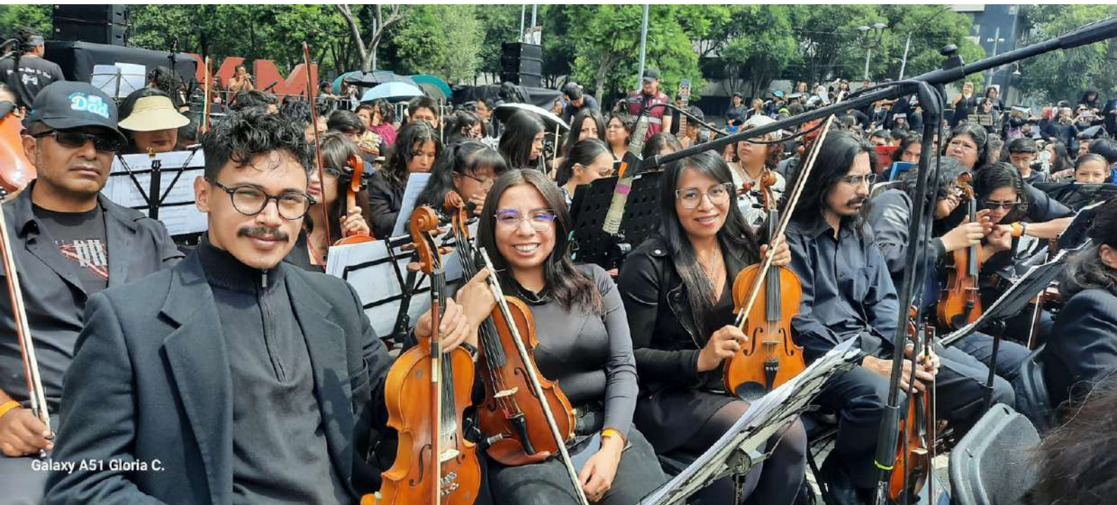
Galaxy A51 Gloria C.