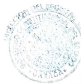
FIGURA DEL REGISTRO CIVIL TEOTITLAN DE FLORES MAGON, OAXACA

SELLO DE LA OFICIALIA DEL REGISTRO CIVIL