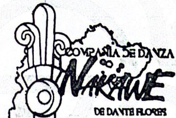
Miguel Martínez Chávez Fotógrafo de la Galería de Aniversario